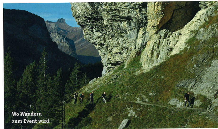
Wo Wandern zum Event wird.

Mehr Informationen auf www.sclassic.ch .